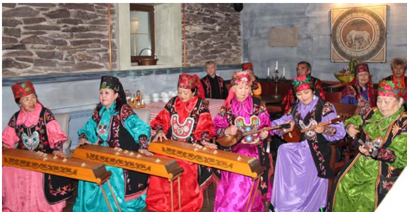
Выступление хакасского народного художественного коллектива «Чон кӧглері» (Народные мелодии) из Абакана

Performance of the Khakass folk art collective «Чон кӧглері» (Folk melodies) from the city of Abakan