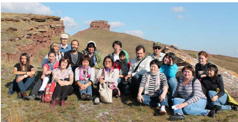
Участники полевого семинара на г. Первый Сундук

Performance of the Khakass folk art collective «Чон кӧглері» (Folk melodies) from the city of Abakan